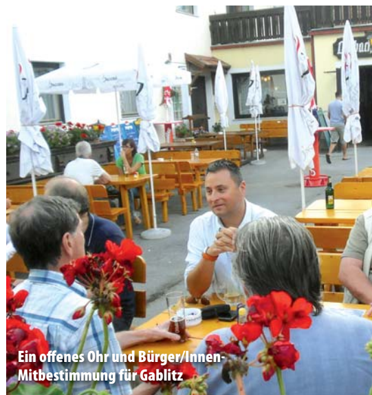
Ein offenes Ohr und Bürger/Innen- Mitbestimmung für Gablitz

Ich bin überzeugt, Politik für die Gemeinde heißt zusammen zu arbeiten. Nicht die Fehler bei anderen zu suchen bringt Gablitz weiter, sondern eigene Ideen einzubringen, anzupacken und für Gablitz zu arbeiten. Und das möchte ich Ihnen versprechen. Ich arbeite sehr gerne als Bürgermeister für Gablitz, und wenn Sie meinem Team und mir am 25. Jänner 2015 Ihr Vertrauen schenken, kann ich Ihnen weiter ehrliche Arbeit für unsere Gemeinde versprechen. Dabei geht es aber diesmal um jede Stimme – es geht um IHRE Stimme!