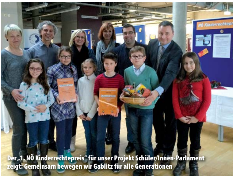
Der „1. NÖ Kinderrechtepreis“ für unser Projekt Schüler/Innen-Parlament zeigt: Gemeinsam bewegen wir Gablitz für alle Generationen