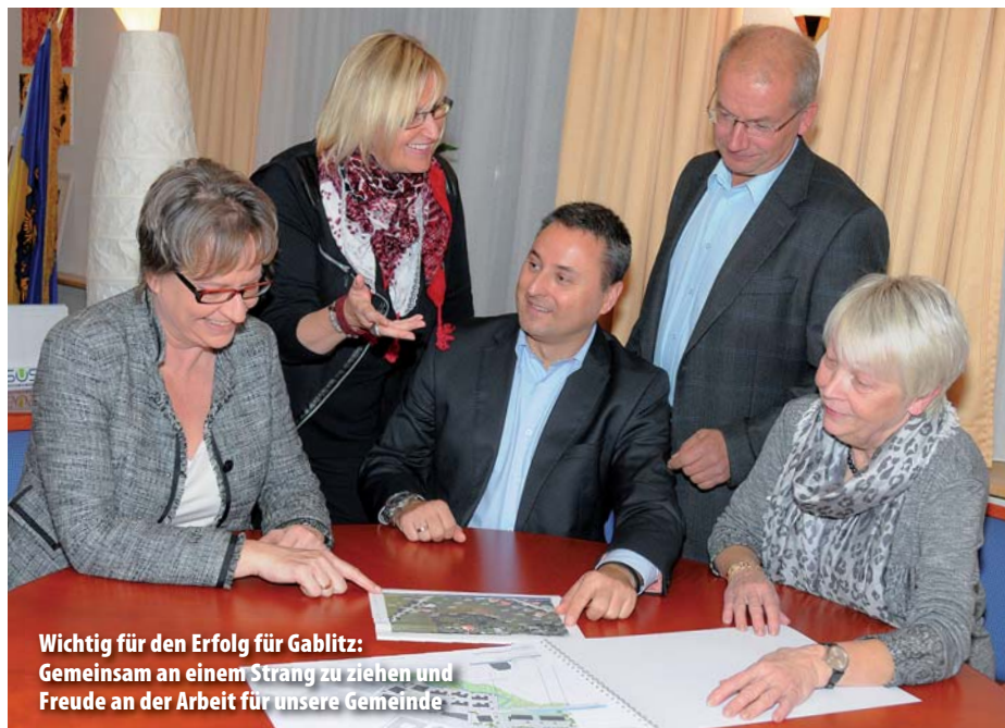
Wichtig für den Erfolg für Gablitz: Gemeinsam an einem Strang zu ziehen und Freude an der Arbeit für unsere Gemeinde